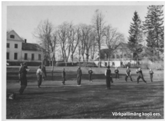
Võrkpallimäng kooli ees.

Peale kooli pidin kodus ema aitama. Mõnikord oli vaja loomi talitada, teinekord jälle väike vend hoidja juurest koju tuua. Ema käis linnas töö, et perele elatist teenida. Isa oli viidud